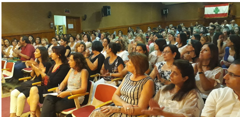
L'assemblée des professeurs au théâtre de Jbeil